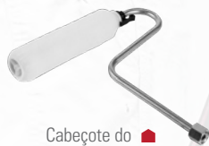
■ Cabeçote do Inner-feed Roller