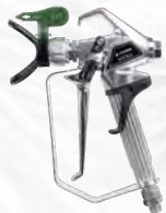
■ Pistola de 4 dedos RX-80 com ponteira HEA