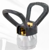
■ Proteção da ponteira